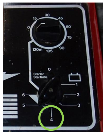
Ladeschalter auf "4"