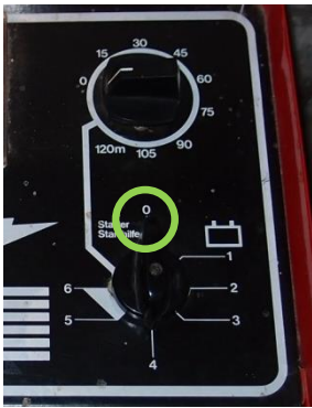
Schalter auf "0"