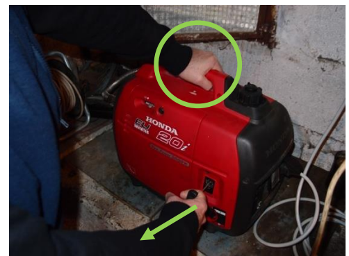
Startseil ziehen => Startet