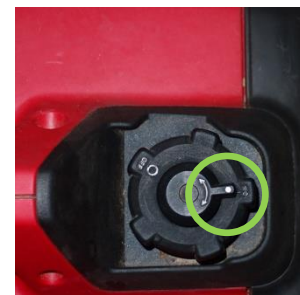
Tankdeckel: Lüftung "ON"