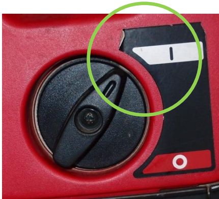
Hauptschalter auf "I"