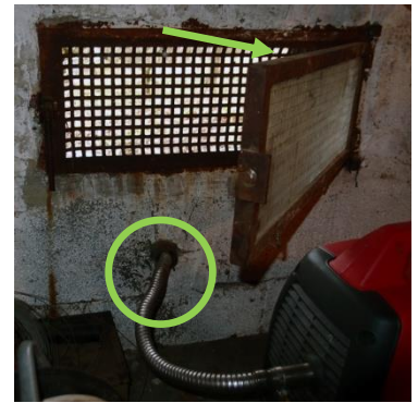
Auspuff ins Freie, Fenster offen