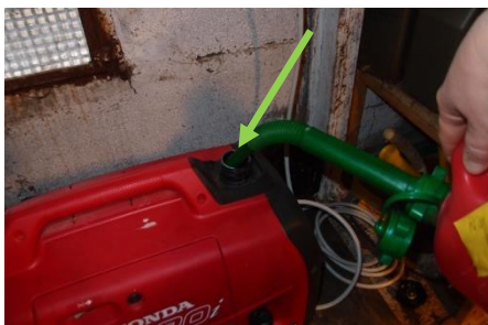
ev. Benzin nachfüllen